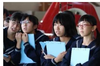
資料8 緊急出動の様子を 見つめる生徒