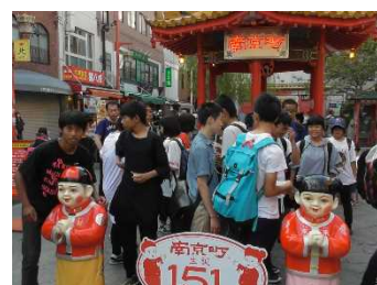
資料 35 南京町での活動

渚中のみなさんが作った花道で、見送ってもらい、南京町へと向かった。班別分散での活動となり、中華料理やスイーツを食べ歩く姿が見られた。短時間の活動ではあったが、「この肉まんは絶対に食べる!」「もし並んでいたらやめよう」などと事前の行動計画を生かして、十