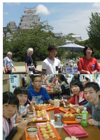
資料 31 姫路で活動する様子

朝早くの出発にも関わらず、バス内はレクで盛り上がった。姫路城に着き、姫路について事前に調べた生徒は、姫路城の歴史や井戸に現れる「お菊」の亡霊が皿を数えるという伝説について説明した。また、おでんや明石焼きなどの姫路市のおすすめグルメを、「班別分散でぜひ食べてみてください！」と紹介した。時間の都合上、姫路城の天守閣に登ることはできなかったが、班別分散では、姫路城内を散策したり、明石焼きを食べたりと充実した時間を過ごすことができた。