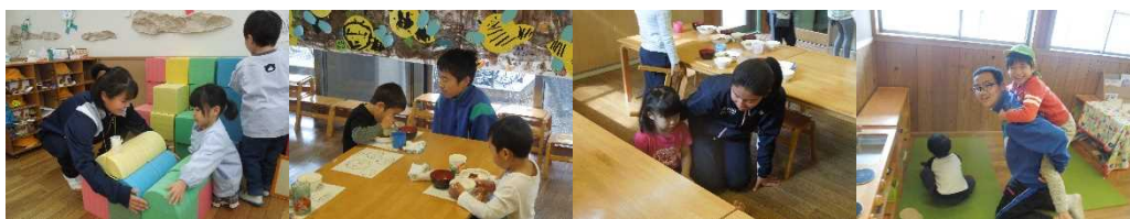
資料 23 保育実習体験の様子

また、事前に行ったマナー講座や保育実習体験を通して、社会での人との接し方や言葉遣い、あいさつ等の礼儀作法を学ぶことによって、社会人として必要な道徳やマナーを身に付けることができた。