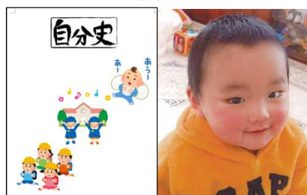
資料 18 生徒の幼少期の写真

「自分にとって家族とは？」という問いに対して、「かけがえのない存在で、家族のためにも自分の人生を大切に生きたい。」と自分の思いを述べる生徒がいた。他にも、自分自身の存在意義を再認識し、前向きに生きていこうとする決意が感じられる記述が多く見られ、命の大切さを実感できた活動になった。