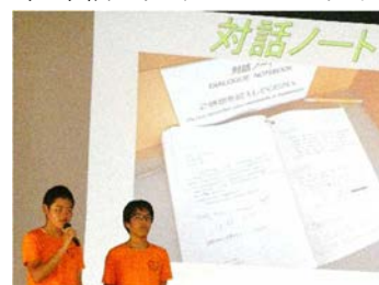
資料 42 報告会の様子

名古屋市立の中学校で初めて広島に行ったことや、1、2年生に千羽鶴の作成を手伝ってもらったこともあり、本校では新たな取り組みとなる修学旅行報告会を開いた。修学旅行班で分担した、「平和」「宮島」「姫路」「渚」「神戸」「グルメ」の6つのテーマで報告を行った。それぞれの班の発表内容や、原稿を見ずに堂々と発表する姿を見て、1年生の生徒は、「自分たちもいつか先輩たちのような報告会を開けるように、一生懸命勉強していきたい」と感想を述べた。また、報告会の司会者が、「私たちの発表をきっかけに、今の生活にある『平和』とは何かを考えてみてほしい」と訴えかけた