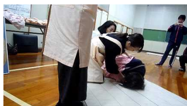
資料22 疑似の産道を通る生徒

最後に、ある女性がトイレで出産し、パニックを引き起こしてしまい、赤ちゃんを殺害してしまった事件があったことを知った。正しい知識と正しい環境で命のバトンをつないでいくことが大切だということが分かった。