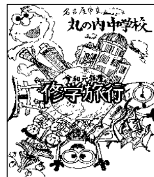
資料 25 しおりの表紙絵

全員が主役となり、脇役となれるように、一人一人に役割と責任をもたせた。しおりを全員で作成するために、必要なページを話し合い、構成することができた。オリジナルのしおりを作成したいという思いから、日程や持ち物だけではなく、「広島弁」「宮島の鹿」について紹介したページも完成した。また、出発式や各目的地において、前に出て話をする場を全員に与えた。出発式等では、担当した生徒の思いが聞けたり、各目的地では、事前に調べた現地の知識や情報を知ったりすることができた。