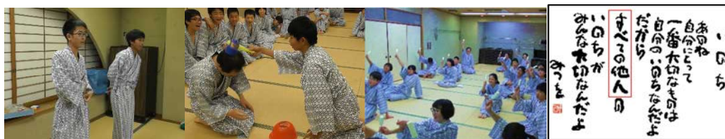
資料 30 学級レクと反省会の様子

できた。その後、旅館「魚光」へと向かった。到着後は浴衣に着替え、大広間に集合し、学級レクと反省会を行った。学級レクでは、担当の生徒が場を大いに盛り上げ、笑いが絶えない時間となった。修学旅行中に誕生日を迎える生徒がいたので、「Happy Birthday」を歌い、ケーキ代わりに全員でアイスクリームを食べた。また、反省会として1日の振り返りをする中で、相田みつをさんの詩「いのち」を紹介した。平和記念資料館を訪問した際の感想を生徒に聞きながら、自分の命だけでなく、「すべての他人の命」が大切であることを実感させることができた。被爆した当時の悲惨な状況を学んだからこそ、生きていることの大切さに気付くことができた。