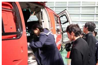
資料7 ヘリコプターに 塔乗体験する生徒