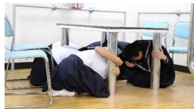
資料4 震度7を体験する様子

防災について、「自分たちで調べたり、勉強したりしたい。」と日記に書いた生徒がいた。その生徒は市内に「港防災センター」や「減災館」があることを調べ、校外学習として訪問することを提案した。訪問した防災センターでは、震度7の揺れを実際に体験したり、地元の災害である伊勢湾台風の被害を学んだりすることができた。減災館では、直下型と海溝型の違いや液状化現象の恐ろしさ、ハザードマップの詳細など、震災についての知識を身に付けることができた。「震度7の揺れが強すぎて怖かった。何もできないと思った。」「揺れで家が倒れなくても、液状化現象に気を付ける必要がある。」などと感想を述べた。事後活動として、テーマ別に学んだことをまとめ、発表会を行った。