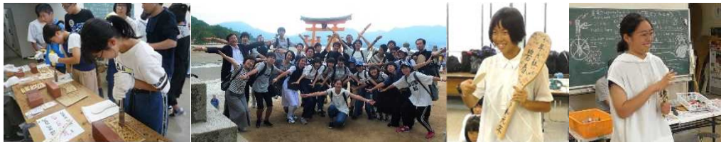
資料 28 杓子作りと厳島神社

厳島神社について事前に調べた生徒は、厳島神社にまつわる神話について語り、「厳島は神様が住む島です。」と紹介した。その後、班別分散で神社を参拝したり、宮島商店街を観光したりして、有意義な時間を過ごすことができた。名物の「もみじ饅頭」や「カキ」を食べたり、家族にお土産を買ったりする姿が見られた。