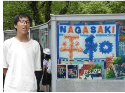
資料 26 思いを語る生徒

新幹線で広島駅に到着し、路面電車で原爆ドームへ向かった。原爆ドームを実際に見るのは初めてという生徒ばかりで、神妙な面持ちで見つめていた。次に、原爆の子の像の前に移動し、平和セレモニーを行った。セレモニーの司会を