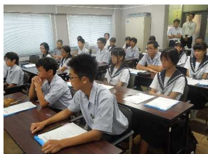
資料11 体験談を聞く生徒たち