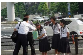
資料6 募金活動の様子

当時、西日本豪雨によって被災した広島県や岡山県の悲惨な状況が連日報道されていた。そのことを知った生徒たちが自主的に学校の周辺に立ち、募金活動を行った。また、報道で必死に救助活動を行う人の姿を見て、その職業について調べたところ、「消防航空隊」ということが分かった。そして、名古屋市消防航空隊を訪問し、話を聞かせてもらうことができた。航空隊員が活動する場所は常に危険であり、一刻を争う命懸けの仕事であることが分かった。話をしてくださっている最中、その隊員に出動命令が出され、緊急出動をしていった。航空隊員のリアルな姿に直面し、生徒たちは緊迫した様子から、「消防航空隊のように命懸けで仕事をしてくれる人がいるからこそ救われる命がある。」ということを知ることができた。