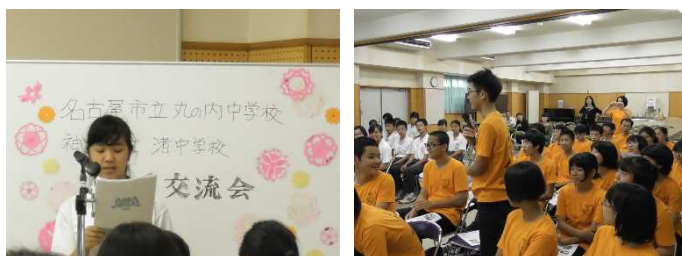
資料 34 防災 J r.との交流会

最後に、渚中学校の防災 J r.との交流会を開いた。防災 J r.の活動報告や防災に対する意識、中学生にできる取り組みについて話を聞くことができた。また、互いの学校の取り組みについて、意見交換会が行われ、和気あいあいとした雰囲気の中、学ぶべきことがたくさん詰まった時間となった。本校の生徒にとって、大きな刺激を受ける貴重な経験となった。