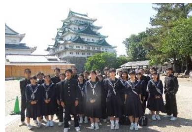
資料3 市内分散の様子

陸前高田交流会をきっかけに、生徒から「中学生にできる防災を学びたい」「他都市の中学校の防災学習を調べたい」という意見が出るようになった。そこで、1995年1月17日に阪神淡路大震災を体験した神戸市立渚中学校にコンタクトをとり、交流活動を行うことになった。渚中学校は震災復興住宅がたちならぶHAT神戸（Happy Active Town）に位置し、各地で行われるさまざまな震災関連行事への参加を通し、単に出来事を見つめ直すだけでなく、防災について深く考える活動をしている学校である。防災について学ばせてもらう前に、「まずは、自己紹介と名古屋のPRをしよう!」と話し合い、市内の観光地や名古屋めしが食べられる飲食店に分散し、PR動画を制作した。