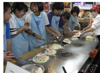
資料 29 広島焼き体験

宮島口からバスに乗り、広島市内の「お好み共和国」へ行き、広島焼き作りを体験した。いただいたエプロンを着用し、全行程を自分の手で行った。生地をひっくり返すことに苦労しながら、おいしく食べることが