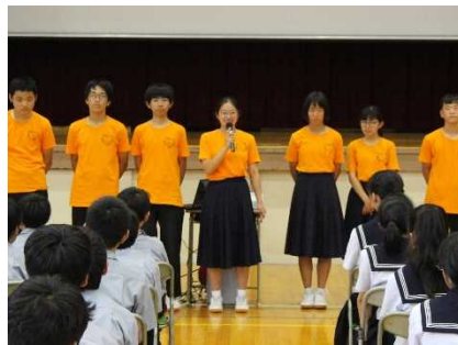
資料 43 司会者が話す様子

最後に、司会者が、「旅館で浴衣を着て行った学級レクや渚中学校で披露した合唱などを通して、クラスの一体感が生まれた」と感想を述べた。残りの中学校生活も自分たちらしく、オンとオフをはっきりさせて楽しく過ごしていきたいという決意が伝わってきた。