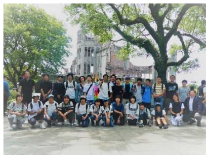
資料 47 平和を願う生徒たち

命の大切さを体感する上で、とても価値のある修学旅行となった。その価値を高めたのは、1年生の頃から命の学習に取り組んできたことだと考える。学級全員が学校生活や修学旅行を充実させようとして、命の学習を創り上げてきた。その成果として、自分たちの手で作り上げた修学旅行という感覚をもつことができた。命の学習と修学旅行の事前学習を密接に関連付けたことで、命の大切さを理解し、自分自身の人生をどのように生きるべきかをしっかりと考えることができた。今後は、修学旅行で学んだことを生きる活力として、進路選択や人生設計に活かせるようにしていきたい。そして、一人一人に与えられた「奇跡の命」を未来へとつなげていけるように指導していきたい。