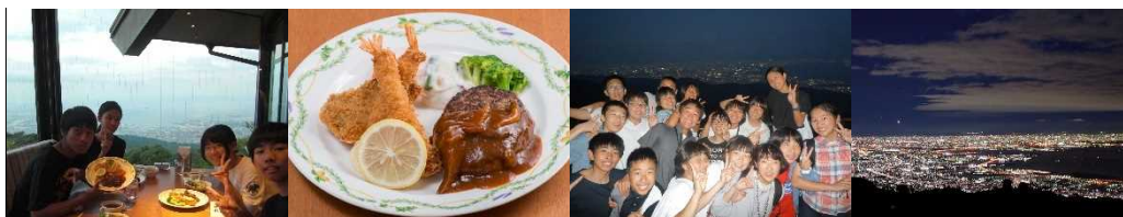
資料 37 六甲ガーデンテラスでの様子

神戸港からバスに乗り、六甲山上にあるレストランへ向かった。修学旅行2日目は早朝からの活動であったが、疲れた様子も見せずに、バス内では歌を歌ったり、山の中の動物を探したりして盛り上がっていた。標高890mのレストランに着くと、店内から見える壮大な景色に「おーっ!」と声を上げていた。洋食ディナーを楽しんでいるうちに日が沈みだし、夕食を終えた班から展望台に行き、夜景観賞をした。展望台からは神戸港や大阪市内などが一望でき、「さっきまであそこにいた!」「あれってUSJじゃない!？」などと興奮した様子であった。