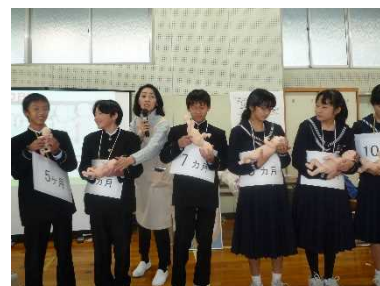
資料21 命の授業の様子