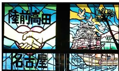
資料2 交流会で制作した スタンドグラス