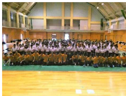
資料 46 渚中学校での記念写真

「防災学習」では、陸前高田交流会をきっかけに、神戸市立渚中学校ともつながり、防災の取り組みを学んだ。防災に対する意識が高まり、港防災センターや減災館に行き、震災に関わる様々な知識を身に付けることができた。近い将来に発生すると想定される「南海トラフ巨大地震」等に備えて、自他の「命」を守る大切さを実感することができた。