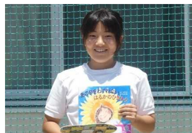
資料9 ひまわりプロジェクトの説明をする生徒会長

ることになり、生徒会のスローガンを「ひまわりの約束」として、3つの約束を掲げた。1つ目は、個々がひまわりのように強く、大きくなること。2つ目は、集団としてひまわりのように全員で同じ方向（目標）を目指すこと。3つ目は、ひまわりが咲き誇るような「咲顔 えがお 」で生活することである。ひまわりを育てる過程で、命の大切さや人との関わりの大切さを実感することができた。