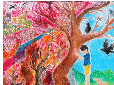
資料 44 入選した感想絵画

広島平和記念式典当日、早朝から平和記念公園には広島市民だけでなく、世界中から何万人もの人々が集まっていた。式典の演説では、戦争を二度と繰り返してはいけないことや、世界中の平和を願うことが伝わってくる言葉が多く使われていた。そ