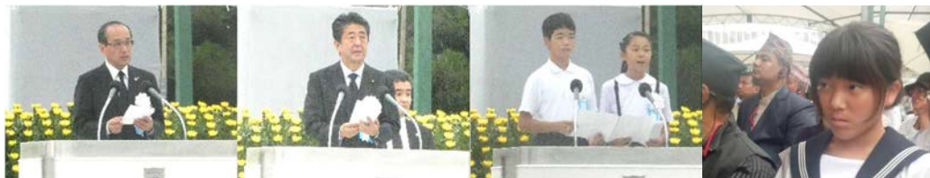
資料 45 広島平和記念式典の様子

の中でも、広島市の代表児童（6年生）が、「悲惨な過去を悲惨な過去のまま終わらせないために、世界中の人たちに伝えていきたい」と訴えかけたことが印象に残り、本校の生徒にも修学旅行に向けて学んできたことを、継続して発信させていく必要があると感じた。8月6日は、戦争や原子爆弾の悲惨さを風化させてはいけない大切な日であることを本校の代表生徒は実感することができた。