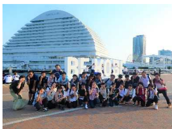
資料 36 神戸港での集合写真

分に満喫することができた。次に、南京町から震災メモリアルパークへ歩いて向かった。道中では、「メリケンパーク」と名付けられた由来や震災時に被害にあった建物について説明を聞いた。震災メモリアルパークには、震災で崩れた波戸場が当時のまま保存されていたり、震災が起こった5時46分を示す石碑があったりして、