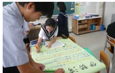
資料5 発表会準備の様子