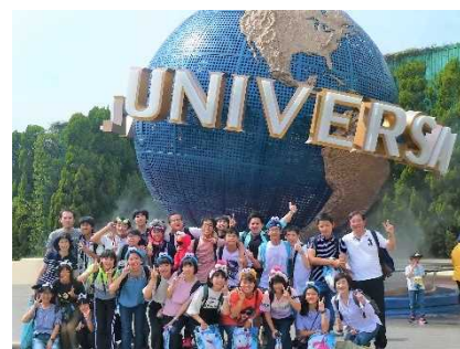
資料 39 US Jでの様子