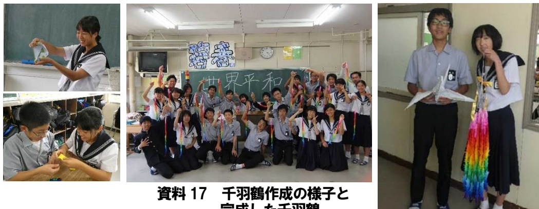
資料 17 千羽鶴作成の様子と完成した千羽鶴

し、修学旅行で平和記念公園に奉納しようという取り組みにつながった。半分以上の生徒が鶴を折ることができなかったが、3年生が主体となって1、2年生に教えることで、全員が折れるようになった。そして、平和に対する意識の高揚へとつながった。