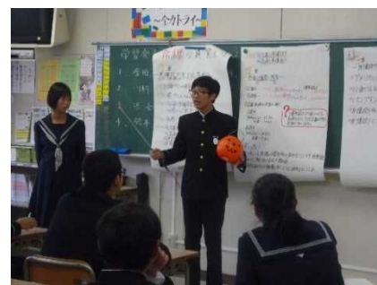
資料 15 学習発表会の様子