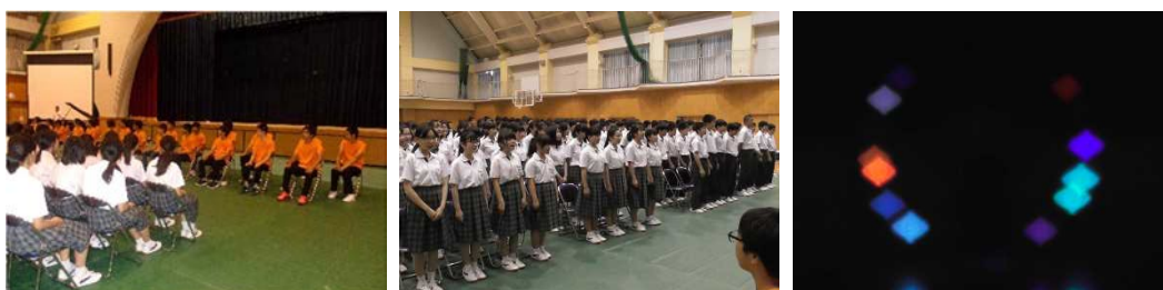
資料 32 両校の学校紹介の様子と披露したトワリング