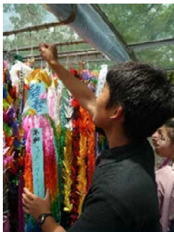
資料 27 千羽鶴を奉納する生徒

担当した生徒は、「僕たち一人一人の思いや行動で世界を変えることができると思う。争いをなくしていき、平和に近づいていきたい。」と平和に対する思いや願いを語った。その後、全校生徒で作成した千羽鶴を奉納し、全員で黙とうを捧げた。