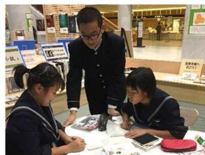
資料 14 愛知県図書館での調べ学習

文化発表会での被爆ピアノとのセッション後に、「戦争に関してもっといろんなことを具体的に調べたい」という意見が出てきた。そこで、生徒たちが、「名古屋の被害」、「原子爆弾」、「特別攻撃隊」、「戦後の復興」というテーマに分け、隣接する愛知県図書館を活用して、調べ学習を行った。また、自分たちも人に伝えることができるようになっていきたいという思いから、平和学習発表会を開くことになった。海外には「原爆投下は戦争を止めるために有効な手段だった。」という見方があることを知り、生徒たちは驚いた様子だった。生徒たちが一生懸命調べてきたことを語り掛けるように伝えようとする姿から、平和を願う気持ちの高まりが感じられた。