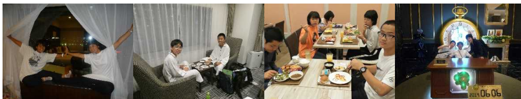
資料 38 ホテルでの様子

たちはうれしそうな様子だった。ただ、さすがに疲れていたのか、事後の生徒の感想に、「めちゃくちゃきれいでテンションが上がった！でも、すぐに寝てしまったので、もったいなかった気がする」と書かれていた。また、翌朝のビュッフェでも、大阪名物のたこ焼きやUS Jのキャラクターが描かれたオムレツなど魅力的な食べ物が多く並んでいた。何度もおかわりを取りに行き、普段よりたくさん朝食をとる姿が見られた。