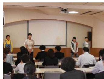
資料 24 説明会の様子

自分たちで修学旅行をつくり上げるために、ルールや服装・持ち物を検討していた。ルールに関しては、様々な意見が出た中で、2つのことを徹底しようということになった。1つ目は、オンとオフをはっきりさせること。学ぶところでは真剣に学び、楽しむところでは全員が笑顔になれるような雰囲気をつくるということである。2つ目は、人任せにしないことである。本学級の課題として、「誰かがやってくれる」という気持ちをもってしまうこと。人任せにせず、自ら積極的に行動することを約束した。2つのルールを意識しながら、必要な服装・持ち物を検討していくことができた。服装は華美でなく動きやすいことを基本として、2日目に渚中学校を訪問する際には、「ユニフォームみたいに揃えれば、一体感が出るんじゃない?」「じゃあ、いのていー(命T-シャツ)を持っていこうよ!」という意見が出され、命T-シャツで訪問することになった。また、これらのルール等に関して、修学旅行説明会で保護者が見守る中、生徒たちが自ら説明した。生き生きと説明する姿が見られ、保護者の方からも、「今から修学旅行が楽しみです」というお言葉をいただいた。