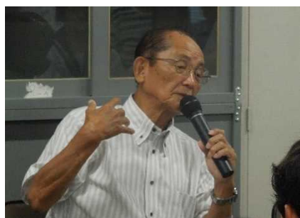
資料10 体験談を語る様子

戦時中、戦死前提の体当たり攻撃を行った特攻隊員について、全校集会で校長講話を行った。その中で、何名かの隊員が家族に残した手記を紹介した。その講話をきっかけに、戦争に関する知識を深めたいという生徒の希望から、学区内にある「愛知・名古屋 戦争に関する資料館」を訪問した。そこで、「戦争の体験談を聞く会」として、戦争体験を聞くことができた。空襲時の防空壕の緊迫感や極度の食料不足、家族を失う絶望感など現代とはかけ離れた状況を学ぶことができた。当時の様子を語ってくださった体験者の方は、「今の生活は本当に恵まれている。このことを忘れないでほしい。」という言葉を何度も繰り返していた。生徒たちは今の生活のありがたさを実感することができた。