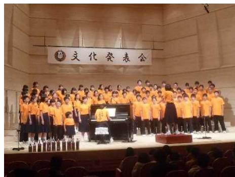
資料 13 全校合唱の様子