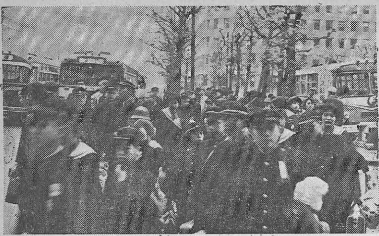
東京駅(丸ノ内口)における修学旅行の生徒たち

東京へ修学旅行に来る必ず訪れる、周囲の学生を利用すれば、一天皇を祭る明治神宮、戦死者の御霊を祭る靖国神社、自立鉄塔世界一を誇る東京タワー、芸術セタの「上野公園、浅草六区」の国際劇場、義士で名高い皇居、豊富な資料を持つ交通博物館、日本一の三越百貨店、NHK、フナタリ