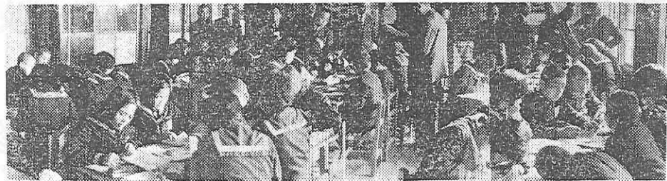
五井中の公開授業参観風景

三十六年度の関東、東北ブロック修学旅行研究発表会は、千葉県教育委員会、全修協、五井町教育委員会共催、千葉県教育員組合、千葉県小、中、高校長会の後援により、去る十二月十二日(火)午前九時より、千葉県市原郡五井中学校において県内外より約二〇〇名の参加者を得て盛大に開催された。