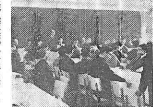
上野松坂屋の「岩手を語る会」

修学旅行のための「岩手を語る会」が、去る一月二十一日午後一時より東京上野松坂屋百貨店において、岩手県などの主催に開催された。都内の公私立中高校の先生が百名以上出席したが、東北地方の修学旅行について、輸送や宿泊、見学地などの詳細に亙る有益な意見が出て非常に参考になる点が多く午後三時半終了した。