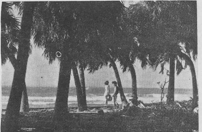
宮崎県青島海岸の熱帯樹