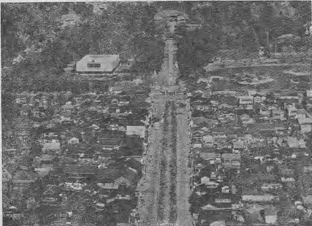
中央の大通は鎌倉の中心若宮大路、その奥が鶴ヶ岡八幡宮、左の白い白亜は近代美術館

江ノ島の片瀬海岸には水族館とマリナランドがあり、修学旅行生や天がまつられている。昔は鎌倉武士の信仰が厚く、江戸時代には庶民階級の信仰で栄え、今日に至るまで