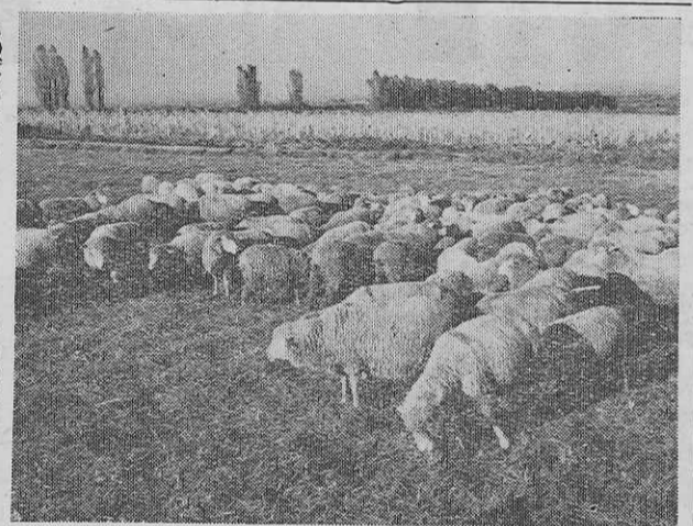
北海道の牧羊風景

全国教職員の皆さま、このたび各位を北海道に迎え申し上げることを、大へん嬉しく存じます。 さて、皆さま既に承知のとおり北海道は開発九十年余の歩みを経て、現在の経済的文化的発展をみましたが、なんとも申しませんが、広大な地域(それは東北六県に新道、または四国、九州に山口、広島四県を合せたよりも広い)であり、またまた未開拓の資源が豊富の手を待っています。 このたびの承知の上、後後わが国に残された唯一の希望地として北海道総合開発が進められ、今年はその第二次五年計画の第三年度に入っております。われわれ道民は、