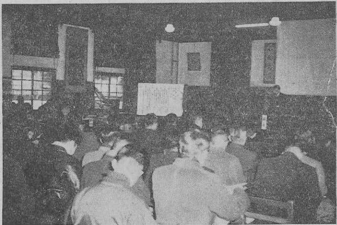
真剣に研究討議を行う熊本市五福小学校における修旅発表会

修学旅行のシーズンにむけて全修協主催による修学旅行の研究発表会が、去る二月二十日(神奈川県藤沢第一中学校を初めとして)二月十九日には熊本市五福小学校に、二月二十日には兵庫東立兵庫高等中学校に、それぞれ県内外より多数の来賓や講師、研究発表者や数百名の参加者を得て、盛大に開催され、終日熱心な研究発表や討論、講演が行われ、校外教育の一環としての修学旅行の重要性を認識するのみに大いに役立った。