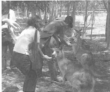
動物たちとのふれあい体験

2000年のオリンピックが開催された大都市シドニー、かつて首都が置かれ、英国調の面影を強く残すメルボルンを中心とするオーストラリア南東部は、一般的な観光資源のみならず、魅力的な学習素材が溢れている。その豊かな大自然の恩恵と多彩な文化が融合し、温暖な気候とフレンドリーな国民性、安全性を併せ持ったオーストラリアは、教育旅行の拠点として、今後さらなる充実発展が期待されている。今回オーストラリア政府観光局ならびにビクトリア・ニューサウスウェールズ両州政府観光局の協力による現地研修同行にあたり、以下のとおりその魅力的な学習プログラムをご紹介します。