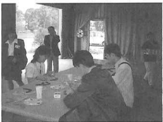
アボリジニ文化を学ぶ

オーストラリア情報の問い合わせ先 オーストラリア政府観光局 東京03-5972-2000 大阪06-6306-2000 URL http://www.australia.com ビクトリア州政府観光局 東京03-5214-0787 URL http://www.visitmelbourne.com ニューサウスウェールズ州政府観光局 東京03-5214-0777 URL http://www.tourism.nsw.gov.au