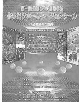
『第1回修学旅行ホームページコンクール』

財団法人全国修学旅行研究協会(後援)全国修学旅行研究協会(谷合良治理事長)は、今後の修学旅行の充実・発展と、これに関連するインターネットのさらなる活用促進を目的として、『第1回修学旅行ホームページコンクール』(主催)全国修学旅行