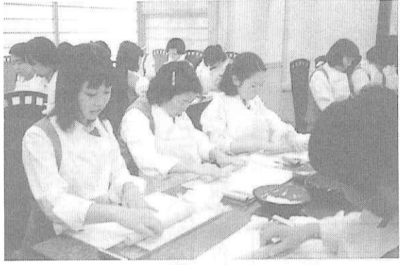
体験してこそ知った八ツ橋の奥の深さ

1. 旅行内容 旅行期日：例年3泊4日の行程にて実施 旅行先：京都ほか 2. 学習のポイント ・学習の場を学校から京都を中心とする関西地方に移し、その文化や伝統自然に接し、知識を広めるとともに、豊かな情操を養う。 ・集団生活の中で、自己の立場と責任を自覚し、自立的主体的行動が取れるようにする。