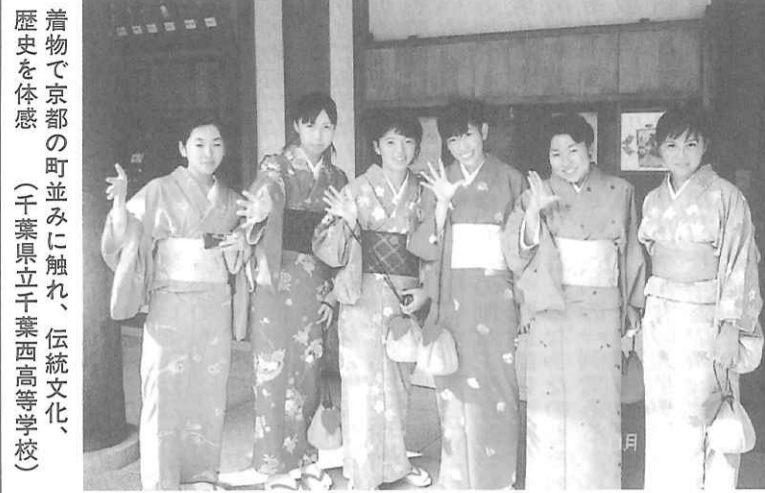
着物で京都の町並みに触れ、伝統文化、歴史を体験 (千葉県立千葉高等学校)

現在、沖縄県民の生活は以前と変わらなく平穏に営まれていくにもかかわらず、米同時多発テロ事件の影響により、修学旅行を中心にキャンセルが続くなど観光客が大幅に減少し、沖縄の観光は大きな打撃を受けています。このような状況を受けて、本日、沖縄に観光関係者のトップが集まり、沖縄観光振興宣言を掲げました。