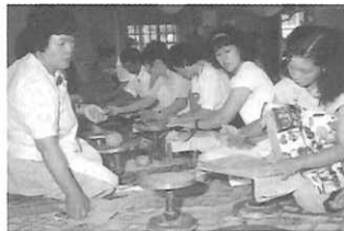
平清水焼と山形県郷土館

村山、庄内、置賜、最上と地域によって気候風土も言葉も違う山形県。自然体験から伝統工芸への挑戦など、それぞれの地域色を活かしたさまざまな体験のメニューが目白押しです。自然と人が「響きあう暮らし」に共感する旅行になるはず。 (社団法人山形県観光協会より)