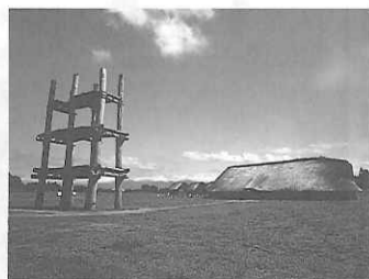
青森県・三内丸山遺跡