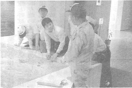
水俣病資料館にて館員の説明を受ける

往復の交通にフェリーを利用した船内学習の実施。 ・グループ別船内探検 ・ゲーム ・水俣での学習活動を振り返って