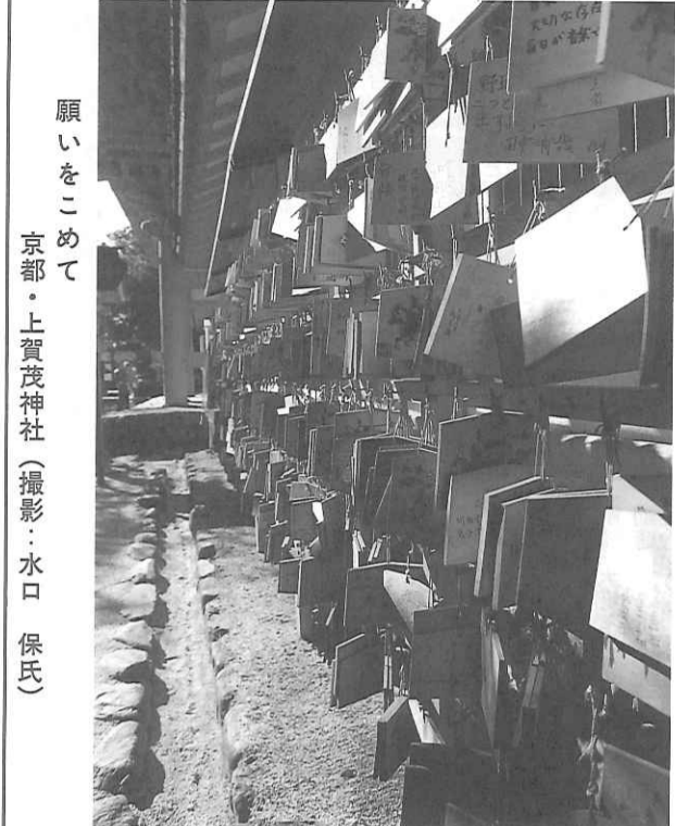
願いをこめて 京都・上賀茂神社