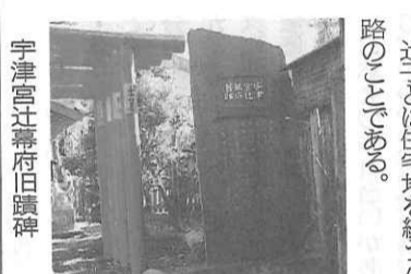
宇津宮幕府旧蹟碑

鏡は、七日 丙戌 先づ鶴奉行とし御事作事を始め、岡の八幡宮を遙かに拝み奉る(中略)知家事兼道山ノり給う。次に故左典範の龜内宅(いへ)を点して移す。谷の御旧蹟を監臨し給う。されざるを建立す。比屋は正即ち当所を点じ、御事建曆(九九〇)九五、年中有りと見えども、地形広きの災にあわず云々である。 又岡崎平四郎義實、十二月十二日頼朝は上総介彼の没後を訪い奉らんがた、広常の仮宅から新邸に移つ