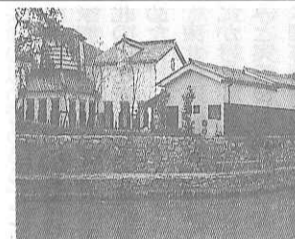
アムが誕生した写真