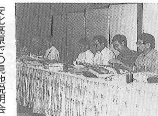
安比高原での現地説明会

十四名が参加して現地視察を行うとともに、三県の観光及び現地の観光協会等関係者と熱心な意見交換、協議を行い、大変中身の濃い現地研修となった。