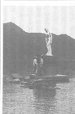
日本一深い田沢湖

八幡平山頂の景観を築んだ後、青森コースの方々と別れる。最初の見学地は、鹿角観光ふるさと館「あいらあ」。最初に「まきころ」に挑戦し、現地の方々の懇談を進めるうちに、自作のきりたんぼが焼きあがり、昼食に供される。栄華を誇ったという尾去沢鉱山の廃坑を利用して作られた「メインランド尾去沢」で往時をしのぶことも、レーザー光線や音響をふんだんに使った「コスモアドベンチャー」体験も圧巻。童心にかえって、ひとときを過ごした。