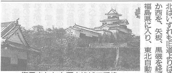
復元された白河小峰城三重櫓