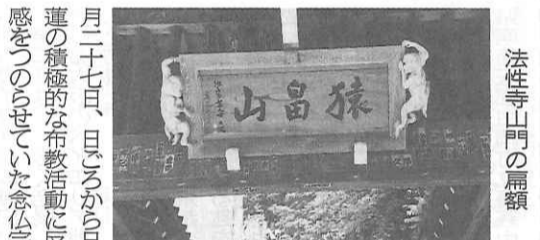
法性寺山門の扁額