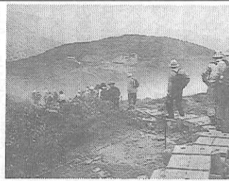
木道を行く研修旅行参加者