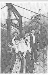
雨あがりの上高地河童橋で

僕は、この修学旅行に大切なことを二つ教えてもらったと思います。黒部ダムであの長い階段を一步一步上っていったから風景が美しくなった。上で飲んだジュースがおいしかった。どんな美しい風景もその前の苦しい道のりがなければ、あんなに素晴らしい感じはないのだと思います。もう一度