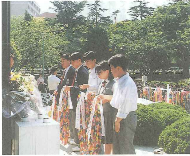
長崎で平和を誓う地震被災地の生徒たち (兵庫県芦屋市立潮見中学校 2面に作文)