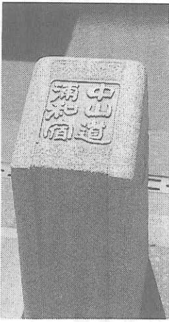
浦和市の中心を縦貫

では県道、それから下諏訪 までは国道14号線、更に塩 尻までは国道20号線とな る。 鉄道は大宮までがJR埼 京線、高崎までが高崎線、 追分までが信越本線、下諏 訪から塩尻までは中央本線 が平行するが、追分から下 諏訪までは道路のみの区間 で、JRバスが一部を除き 季節運行している。なお、 建設中の北陸新幹線は、軽 井沢から塩田までやちや並 走する。