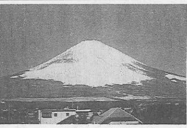
吸が至難でしょう。誠意は必ず企画にも現れます。種々なめぐりもなつて。 「正月は思えば感のかたきかな。風狂の詩人・一休のシニカルな言葉です。十人十色の前の全修協の旅行企画にまずは敬意を表したい。いつ見ても誠に上出来です。見ただけでも結構楽しく、苦勞の跡もしのばれます。どか今年もよろしく願ひます。」 (福井県中学校生活協同組合 専務理事)

多くの人が旅するようになり、旅は大衆化され、生活の一部になりました。小言の多い世の中に、結構なほどはなさないでいようか。 「何もないときには何もなしなものか一番良い。小人はどのとき何がよかったか。どか言われた人があったようにです。いみじき言ひを思ひます。親切も度を越せば強情となり、旅のプランもこの間の呼