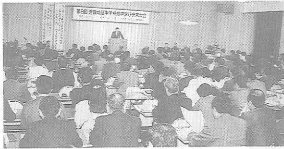
11月19日 和歌山・紀の国会館