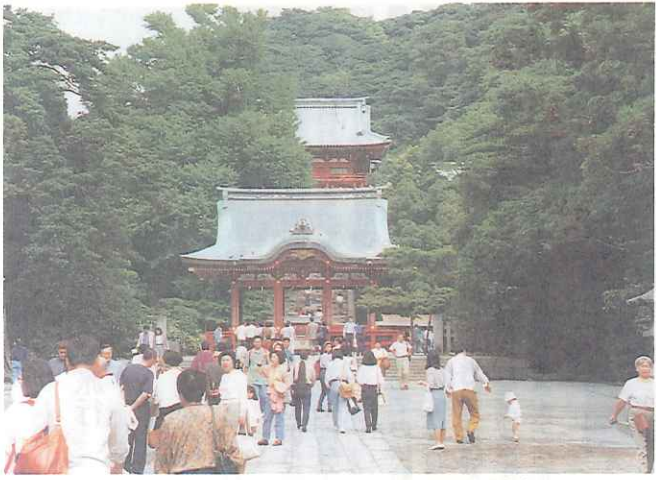
若宮大路の奥に鎮座する鶴岡八幡宮

△鎌倉の歴史(2) 鎌倉時代(鎌倉)鎌倉に入... 頼朝はまず亀ヶ谷の義朝... 館跡で父の霊を祀った。今... の寿福寺がその地である。... しかしここは敷地が狭かっ... に迅速に進められたかは、