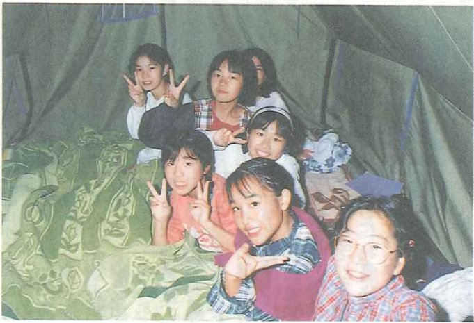
(日光にて 東京・延山小 前から5人目が2面作文の筆者)