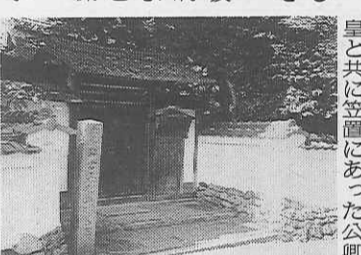
岩倉具視公旧宅の表門付近

岩倉具視は和宮降嫁の中心人物で、公武合体派とみられた。そのため尊攘派の人たちにならわれ、この地に五年の間隠れた。