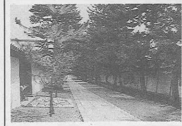
花園。その名を耳にするだけで心を引かれるこの地は、平安の初期、右大臣清原夏野の山荘があった。夏野は、小野篁とともに「全義解」の編纂で知られるが、また、四季にわたって多くの美しい花を咲かせた。それが花園の地名の起源だといわれている。

方丈（重文）の南西部。妙心寺と法金剛院は、京都の重要な文化財である。妙心寺は、臨済宗妙心派の大本山であり、法金剛院は、法相宗の寺院である。両寺院は、京都の歴史と文化を伝える重要な場所である。