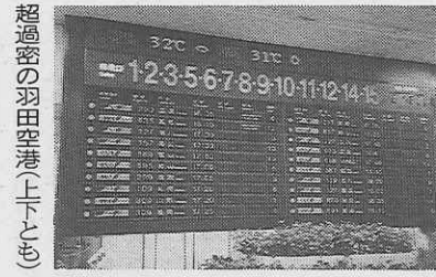
超過密の羽田空港(上)と(下)