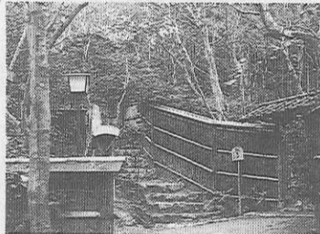
祇王寺入口の滝口寺は石段上

事とともに、南北朝の恩讐を越え、人の心にゆきもりを与えてくれる逸話である。 ……恩讐の彼方への塚椿落(平野溪村) 墓前には石灯籠が立ち、鉄斎の揮毫が目を引く。碑文に「精忠(正行)とある。「丸に二の流」と「菊水」の紋が歴史を偲はせる。 ……かえりこたえて思へば梓弓、なき数に在る名をそとせむ。 正行辞世の歌の碑は、この奥の竹林が、吉野ならぬ嵯峨野の雲間を醸し出す。 愛宕街道を祇王寺に向かう。その途中、右側の小路の入口に「小倉山荘旧址祇王寺」の碑がある。