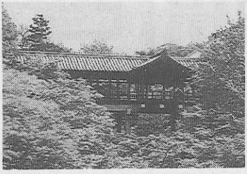
新緑が萌える東福寺の通天橋

平安の昔、東山山麓には、南から法性寺、法住寺と続いて、北の岡崎には、法勝寺を中心とする六勝寺が築を築っていた。それが平安京、古都としての原風景であった。 それらの寺は名をどしどし残るのみだが、川にかかる橋は残った。江戸時代、大阪へ行く旅人は、市中を暗い道に出ると、法性寺の橋、二の橋を通る頃、夜が明けたという。……ほととぎす一二の橋の夜明けかな (其色) 今日三十三間堂から南へ、泉涌寺、東福寺と訪ねてみる。……(には)原風景を襲う付まじを見ることが出来る。東福寺は鎌倉末期の創設。南都東大寺と興福寺の二つす