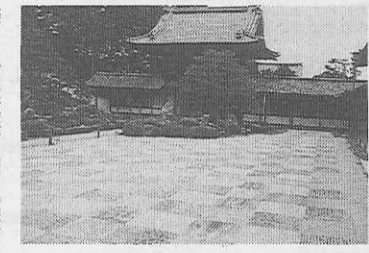
美しい市松模様の開山堂庭園

……北殿司掛きたる大き渾繁図のなかの猫より春は来るのし……(吉井勇) 通天紅葉は嵐山や高雄と、もに名高く、秋は特に賑わう。普通の楓と異なり、葉先が大きく三つに分れているのが特徴である。 ……尋ねきて秋の錦を今日ぞ見る、柳の春は知らね……(本居大平) 今は春、二十本も植えられた楓の新緑が瑞々しく、滴る。……(ついで)