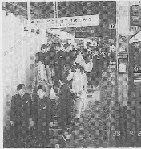
工事中の階段を下りる修学旅行生の列

16・17番線および18・19番線ホームに通じる神田寄りの階段が工事のため、大変狭くなっている。到着列車の下車を優先する建前だが、団体の乗車位置(ひかり10・16号車、こだま6・12号車)にあたるため、ホームの出入りにかなりの時間を要する。 新幹線に乗り降る際はなるべく有楽町寄りの階段・エスカレーターを、また在来線乗継の場合は南乗換改札を利用するよう、JR東海では望んでいる。