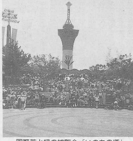
国際花と緑の博覧会「いのちの塔」