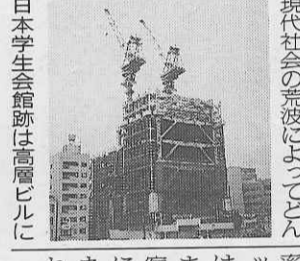
日本学生会館跡は高層ビルに

転業し、一時は百軒にもなった東京・本郷の旅館は、消防法の改正、修学旅行の春・秋集中、受験生の個室希望、更に地価高騰など、諸般の社会情勢の変化に伴って転業業が相次ぎ、現在本郷旅館協同組合観光団体部加盟の旅館は、二十二軒となっている。