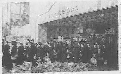
ホテルの前に並ぶ修学旅行生

東京・広島など大都会での宿舎は、旅館からビジネスホテルへと変わってきている。設備もデラックス化し、エレベーター、エスカレーターを利用、和室・大広間から洋室・シングルルームに、大浴場から洗い場のないユニットバスになった。学習指導