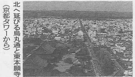
北へ延びる鳥丸通と東本願寺(京都タワーから)

以前は西南にある東寺の塔が目印となっていた駅周辺も、昭和三十九年(一九六四)に京都タワーができて、すっかり趣を変えた。その時にも景観論争が起きたものだが、三十年近く経過した今日、駅前の二つの顔になったことは確かだ。今年の春、外装の塗り替えも終わり、夜も電飾に白亜のタワーが美しく浮かび、観光客に人気のあるのは、観音堂が輝いた。 ……鮮やかな遠くからの許にきて(鈴鹿野風呂) ……入浴や地蔵のゆるゆる、鳥丸通が真直ぐに北に延びる。京都御所や一条城、そして祇園の森が、立て込んだ町並みに印象的だ。鴨川の流れるも、 京都タワーから間近に見える再建の際の秘話は今も両堂をつなぐ回廊に残る。大槩は新堀で明治十六年、周囲約五・五メートルのケヤキの大木を撤出する際使われたものだ。大雪崩に遭い、二十七名の死者を出したという。また、重い用材を引き上げるために用いられたのは、富山・新潟・秋田などの八果の女性たちの黒髪をより合せた「毛綱」だ。明治十三年のことである。古都で最大の建築を誇る東本願寺の御影堂には、(こうし)