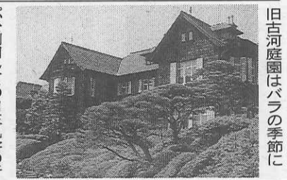
旧古河庭園はバラの季節に

旧古河庭園はバラの季節に、部分開通、既設の地下鉄とは接続しないが、都内の地下鉄網は一層複雑となった。先ず、管地下鉄南北線の赤羽岩淵-駒込間6.3キロが十一月二十九日に開業。北区に初の地下鉄が登場した。王子でJR京浜東北線と都電荒川線、駒込でJR山手線と都電有楽町線が交差する。将来は都心を縦貫、目黒へ延長される予定。 新時代にふさわしく、各駅のホームの線路側を安全対策のため透明パネルで仕切り、駅ごとに色の異なる「ホームドア」が電車の扉と同時に開閉、車両を直視することはできない。また、自動列車運転装置(ATC)によるワンマン運転が行われている。 沿線には見学場所が多く、王子の飛鳥山公園や渋谷史料館、紙の博物館、西ヶ原の旧古河庭園、駒込の六義園など、一日乗車券や東京フリーきつ