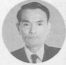
岐阜市立 陽南中学校長