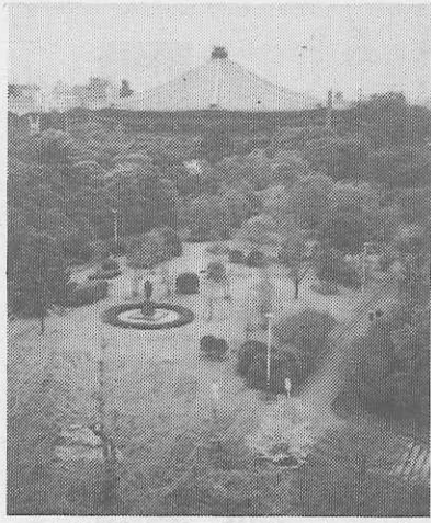
日本武道館と吉田茂銅像 (中央円内)

都心のオアシス、北の丸公園は、もと近衛連隊のあったところ。天皇陛下の還暦を記念して整備、造園、一般に開放されている。緑豊かな園内には江戸城の遺構を伝える田門と清水門、それと赤レンガの国立近代美術館工芸館の三つの重要文化財をはじめ、夢殿を形どった八角形の日本武道館、手のひらをひろげた形の科学技術館、それに東京国立近代美術館、国立公文書館などそれぞれユニークな建物が点在、周りを垣に囲まれ