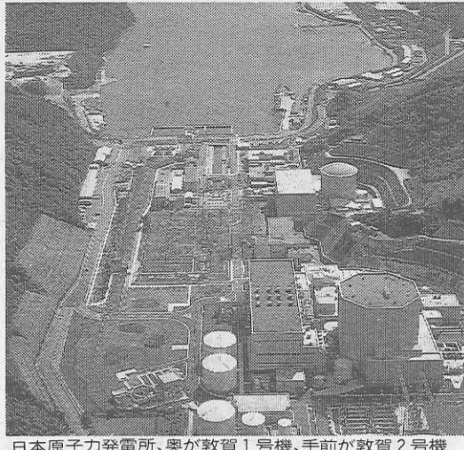
日本原子力発電所、奥が敦賀1号機、手前が敦賀2号機