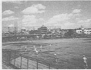
今秋限りの安部球場

田上水取入口大洗塚跡の標識が立つ。ここから船河原橋までをかつては「江戸川」と呼んでいた。丁度高速道路下の区間がそれに当り、江戸川区とは関係ない。今は全区間が神田川である。