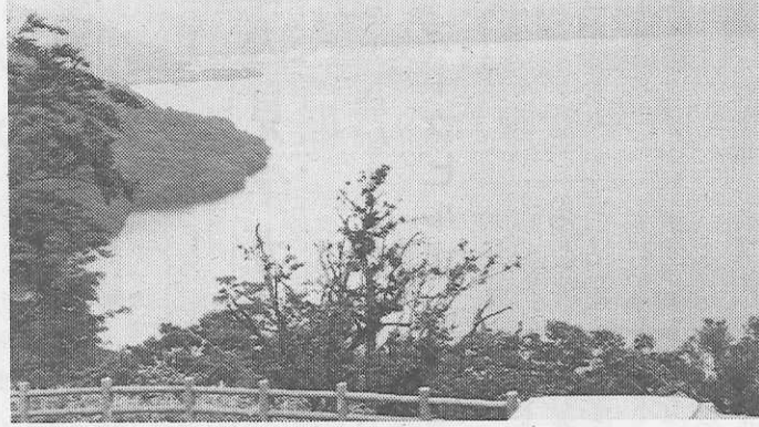
眼下にひろがる紺碧の十和田湖 (発荷峠)

第二十三回東京私学修学旅行現地研修会「秋田・岩手両県の再発見」(主催財全国修学旅行研究協会・協賛東京私立中学高等学校協会修学旅行研究調査部)は、八月二十日から二十五日まで五日五日の日程で二十一名が参加して実施された。 この研修会は、新しい修学旅行地の開発研究と先生方自身の見聞を広めることを目的に、昭和三十九年から継続実施しているもので、今回も各宿泊地ではそれぞれの県の観光課長、地元受入代表者と懇談会をもって現地情報を吸収するなど成果をあげた。