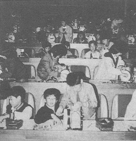
子ども達は目を輝かせ (エンジン教室)

「伊勢に行きたや伊勢路がみたい、せめて一生に一度でも……」江戸期におけるいわゆる「おかげ参り」で知られる伊勢神宮のおわす伊勢路三重県は、本州のほぼ中央部に位置し、東は伊勢湾、南は波荒き太平洋の熊野灘に面し、うしろは鈴鹿山系と大台山系に囲まれた、気候風土温暖で、県民性も温順な住みよい県であります。