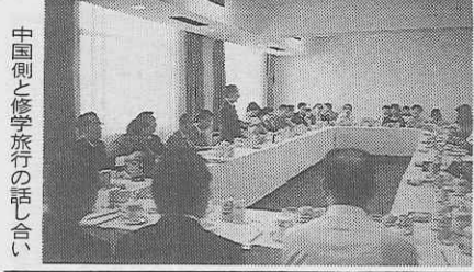
中国側と修学旅行の話し合い

民服はほとんど見られなくなった。街には農民の自由市場が各所にみられ、観光地には中国人旅行者があふれていた。経済的に次第に豊かになりつつあることが肌で感じられ