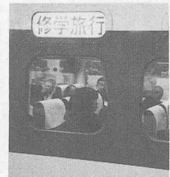
〔修学旅行〕の表示も鮮やか

調査1、事前指導 問①、修学旅行における問題行動の全般的指導はどの場面で行っていますか。 これは三カ年を通じて全く同じ結果が出ている。学年を統一しての指導は学年集会で行い、各学級毎では、道徳の時間、及び特別活動の学級指導、生徒活動の時間が充てられている。