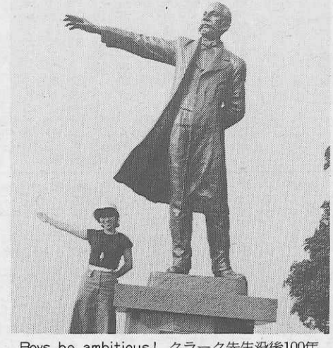
Boys be ambitious! クラーク先生没後100年

期の主眼は、学校行事や学習状況をスライドに収め、それを映写しながら学校生活を反省させる。更に、音楽クラブの演奏などのクラブ活動の発表の場とする。厳粛な中にも楽しい雰囲気があふれ、参加意欲も高まっていく。 (つづく) (大阪府小学校学校行事研究會 会長・助修協大阪副支部長)