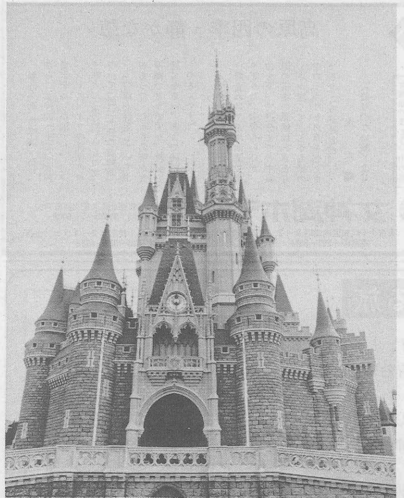
東京ディズニーランドのシンボル・シンデレラ城