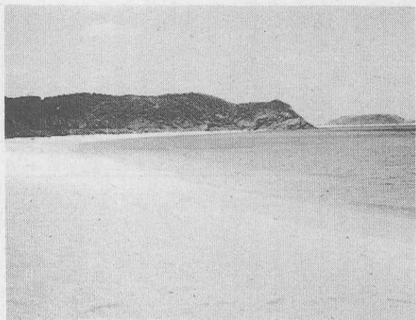
古ザマミビーチ (事務局長うつす)

慶良間諸島は、沖縄本島の西方約四〇〇kmの洋上に点在する大小二〇余の島々の総称である。それらの島々は美しいサンゴ礁の中に浮かんでゴラルランドと呼ばれ、空の青、海の碧とサンゴ礁の真っ白い浜辺のみこと自然の織りなすコントラストがすばらしい。