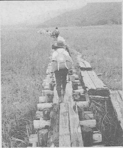
尾瀬ヶ原 (コンクール作品より)

日光国立公園の西部を占める日本最大の高層湿原地帯。動植物の宝庫として学術的価値が高く、ミコトスガキなど、尾瀬の自然を守る会を講師 第二長蔵小屋：沼尻：浅湖湿原