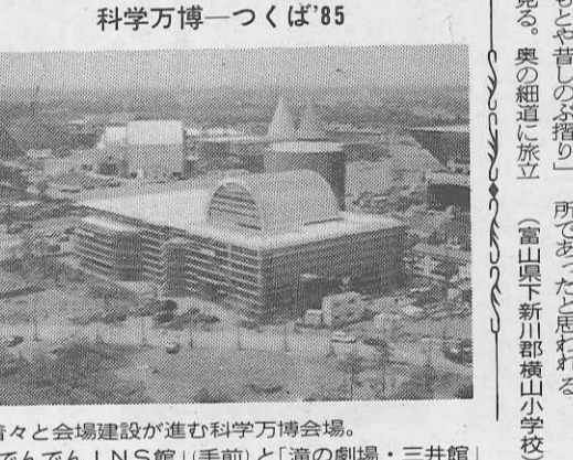
着々と会場建設が進む科学万博会場。「でんでん」NS館(手前)と「滝の劇場」三井館

科学万博一つくば'85 ●営業時間 9:00~17:00 (3月16日~11月15日) 9:30~16:00 (11月16日~3月15日) ●修学旅行料金 高校生 1,000円 中学生 700円、小学生 600円 別府あじむ草原 アフリカン サファリ 〒872-07 大分県宇佐郡安楽町大字南畑 (09784) 8-2 3 3 1代