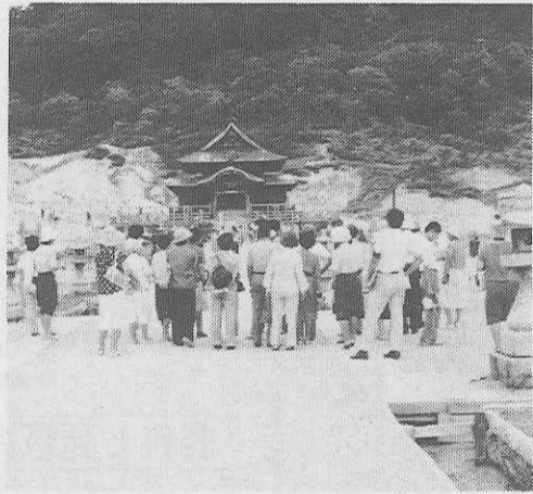
円通寺前の研修旅行図 (広報部うつす)

南部家は源義家の弟新羅三郎義光の後えといわれる。光行の末子は一甲斐に残り日蓮聖人に帰依して仏門に入り日蓮と称し日蓮宗本山身延山久遠寺も東京への移住が命ぜられ、加