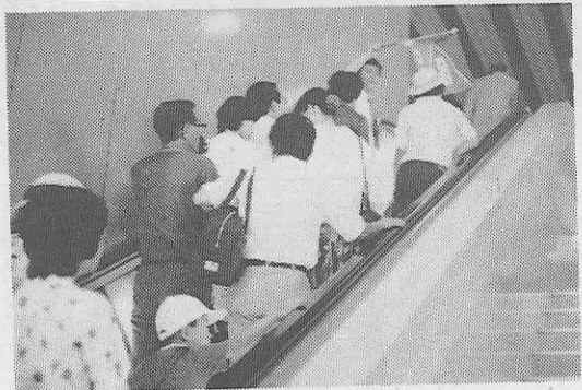
出発ゲートに向う近畿第1団の「フリータイム・ケラマ島」コース（大阪空港で）

夏の教職員研修旅行は七月二十五日、近畿地区のフリータイム・サマミ島、恐山と和田・弘前一両コースを皮きりに国内五十七団海外四団が出発。今回、九州中・北部、山口県の豪雨、台風10号による国鉄をはじめ各交通機関の寸断により一部スケジュールの変更を余儀なくされたものの参加者全員元気に帰着した。