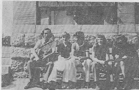
フローレンス街の一角で子どもたちとともに

このように警察(の紹介になる)の時代行列に参加した中世の衣裳のままの観衆が激しい歓声をおこし、その熱狂的な声援をおへり、そのつらきは観衆や選手が入り乱れての取っ組み合いのケンカをはじめ、そしてついに警察がそれを中止させるために催涙ガス弾を連射したと驚きの会場が光景であつた。