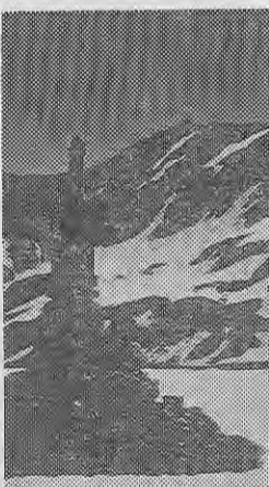
室堂平からみた主峰・雄山(右手)と中央右手は室堂小屋

「立山」とは北アルプス・中部山岳国立公園における最高峰の山と思われ、古く「立山」という固有の山名はなく、地図上は大汝山(おおなんじ)とよま(三〇一五)が最高峰であり、山岳信仰に由来する雄山は二九九二メートルなので、厳中おわら節では「厳中でお立山」加賀では白山、駿河の富士三國一だよと日本三名山として讃えられる立山は、古くから日本三霊山の一つとして尊ばれてきました。立山連峰の総称が「立山」で、