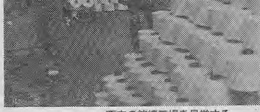
西安の紡績工場を見学する