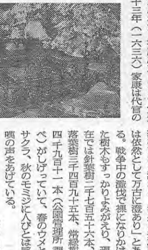
↑家康が愛用したお茶の水の井戸