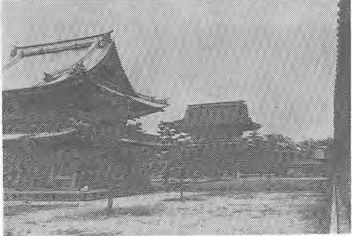
瑞竜寺の仏殿と薬医門