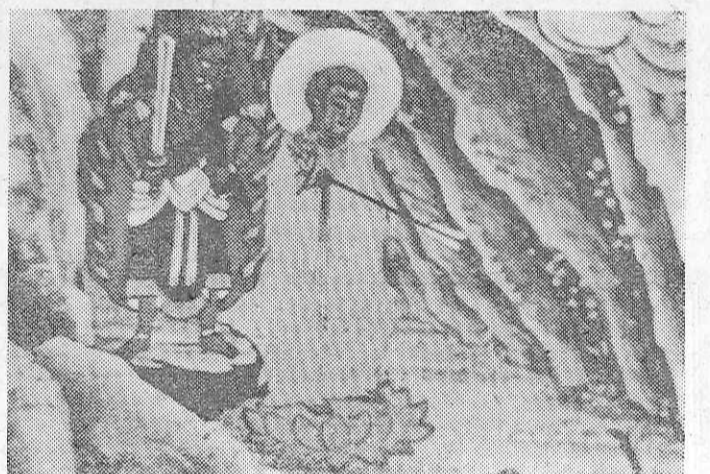
矢ぎの阿弥陀如来 (足下では有頼が伏している)

鳥をたて松を研ぎをとり密に命 がないやうに、よへ見回れと命 じています。また、科学的調査も 行なわれ、立山や白山の雷鳥を 見、その形態や生態を報告させ ているが、立山の雷鳥は「ハト」 みたく、白山は「キジ」に似て 描かれています。