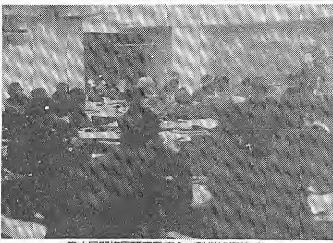
第4回関東修学旅行研究発表会(科学技術館で)