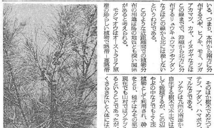
防風林にしているモクマオウ (奄美大島アヤマル峠で筆者うつす)