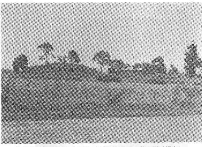
西都原の古墳群