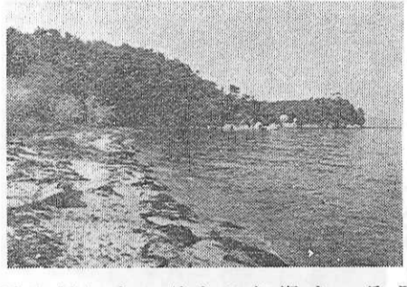
今、狭島を砂浜と青き土...