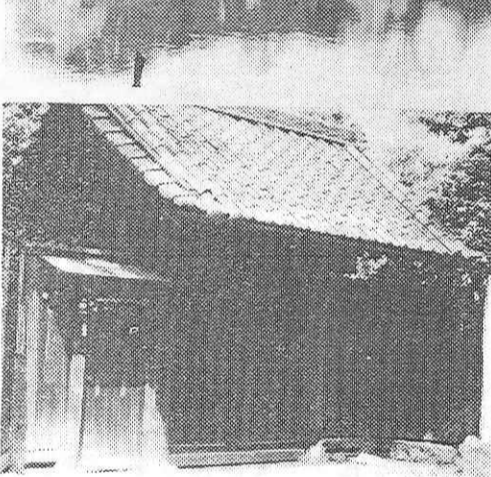
六義園の庭の駒込名主屋敷

【駒込名主屋敷】ここに住んでいたのは高木家の先祖は将監といわれ、うげん、近衛府の判官といわれ、慶長のころ伝通院（伝通院は文京区春日二・三に現存）で、駒込一帯の開拓を行ない、そのまますましたという。高木家は代々特別名勝指定。